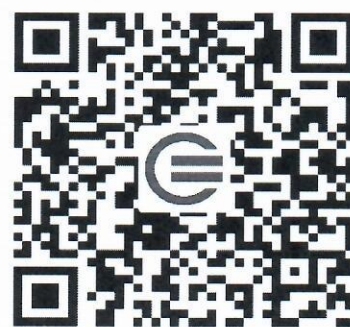
教育装备网公众号二维码

2. 参观人员请扫描右方的二维码，关注“教育装备网”微信公众号，于 9 月 24 日后在报名入口点击“观众预报名”并按要求如实填写相关信息生成报名码，凭报名码到现场换取“参观证”进场观展。